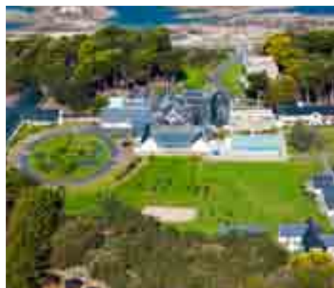
Un village vacances face à l'Océan Atlantique à la pointe du Croisic