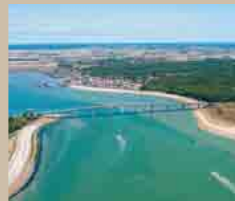
En Vendée, sur l'Île de Noirmoutier...