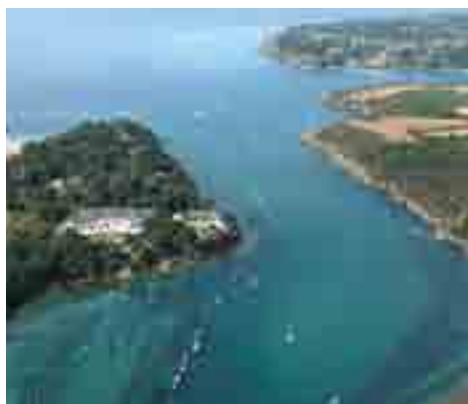
Au bord de l'eau, entre mer et rivières dans le Sud du Finistère