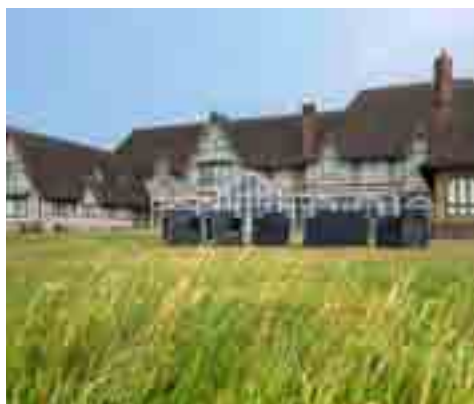
Un village vacances chic et populaire, les pieds dans l'eau, en Normandie