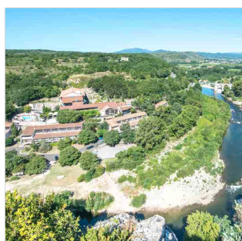
ARDÈCHE MÉRIDIONALE Domaine Lou Capitelle Accessibilité adaptée