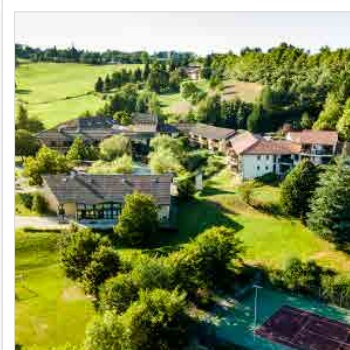
CANTAL MÉRIDIONAL Domaine La Châtaigneraie Accessibilité adaptée

Villages et locations de vacances à la mer, la montagne ou la campagne